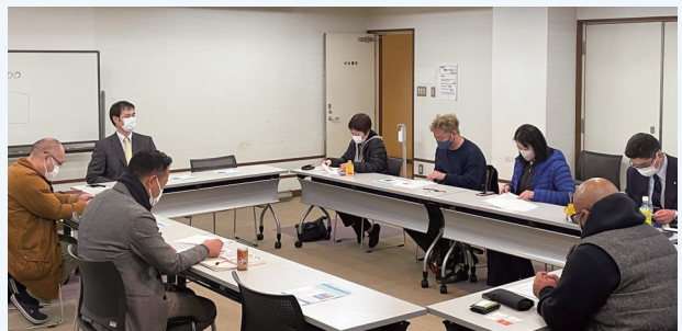
リアルのみで行われた鹿沼・日光支部総会