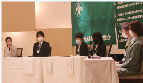
先輩社員によるパネルディスカッション